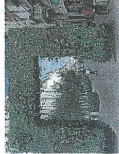
L'arco Rami e rampicanti in via Sarpi

Verde e commestibile, è il progetto di via Paolo Sarpi per Expo: le aiuole di erbe aromatiche, gli alberelli da frutto, un grande arco verde composto da rami e foglie rampicanti. Nasce come controproposta all'idea della comunità cinese di indicare la locale Chinatown con un paifang , un portale d'accesso come nella tradizione dei villaggi d'Oriente e come nelle